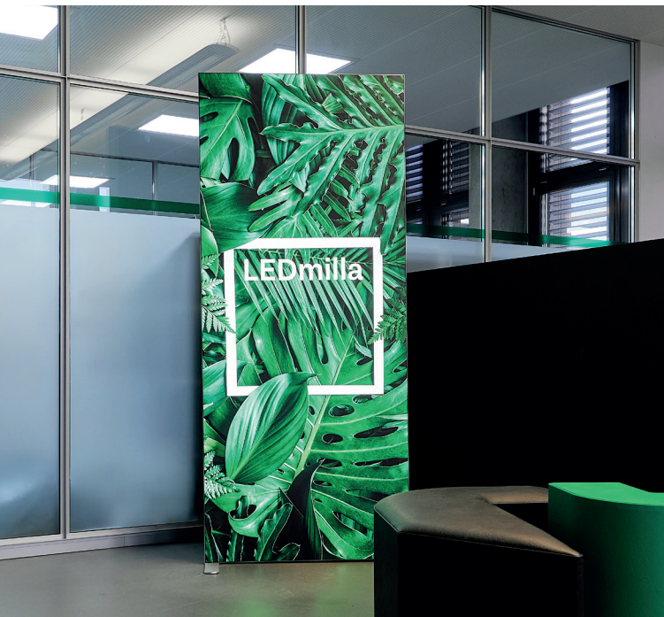
Zur Promotion am POS