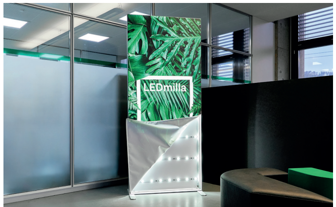
Rückwand mit LEDs