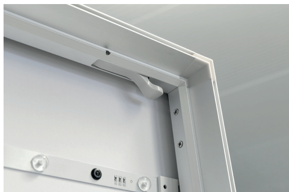
Aufbauen ohne Werkzeug